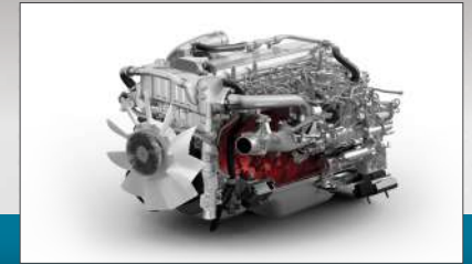
J08E Common Rail | Euro4

Mesin HINO BUS Series dirancang untuk operasional di lapangan secara maksimal selama 24 jam dan 7 hari, bahkan di bawah kondisi yang paling ekstrem sekalipun. Dilengkapi dengan teknologi mesin Euro4 yang memiliki sistem bahan bakar yang dapat diandalkan, untuk bisnis Anda lebih mudah.