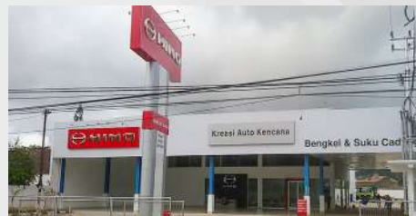
Dealer Resmi Hino Indonesia, PT Kreasi Auto Kencana

PT Kreasi Auto Kencana (KAK) selaku dealer resmi Hino untuk wilayah Papua Barat yang beralamat di kota Sorong terletak di Jl. Basuki Rachmat km 9,5. Merupakan dealer resmi yang memiliki fasilitas 3S (sales, service dan sparepart) yang siap melayani customer Hino di wilayah Papua Barat dan sekitarnya.